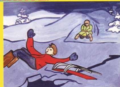
Рисунок Тарновской Юлии