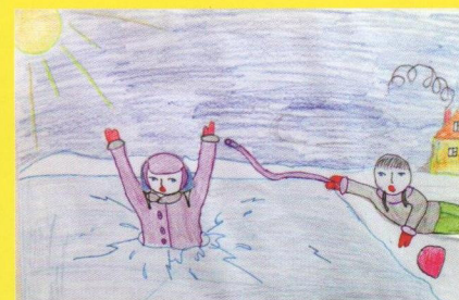
Рисунок Алексеевой Софьи