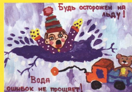
Рисунок Зенищевой Ксении