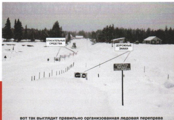
вот так выглядит правильно организованная ледовая переправа

Прежде всего, следует помнить, что переходить и переезжать водоемы на автомобилях можно только на специально оборудованных ледовых переправах. Переправы оборудованы спасательными средствами, там регулярно замеряется толщина льда и температура воздуха, нередко лед и специально «наращивают», для увеличения его толщины.